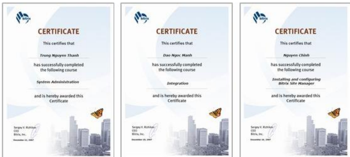
Hình 2: Chứng chỉ Master công nghệ Bitrix24

Với sự am hiểu công nghệ, những thành tựu nghiên cứu và ứng dụng công nghệ kết nối vào thực tiễn kinh doanh và sự công tác, đồng hành của đội ngũ chuyên gia giỏi trong nhiều lĩnh vực trong suốt 12 năm qua, công ty V&V tự tin sẽ là đối tác uy tín và tin cậy trong việc cung cấp các sản phẩm công nghệ chất lượng cao cho quý doanh nghiệp trong và ngoài nước.