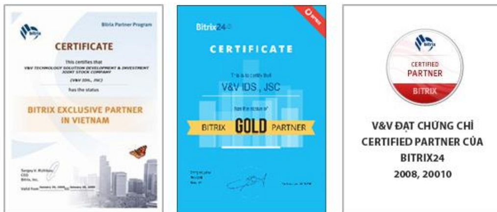
Hình 1: Chứng chỉ chứng nhận đối tác chiến lược Bitrix24

Đội ngũ chuyên gia của V&V tập trung nghiên cứu chuyên sâu, nâng cao trình độ kỹ thuật và quản lý. Chúng tôi đã đạt được rất nhiều chứng chỉ khẳng định chúng tôi là chuyên gia trong lĩnh vực của mình.